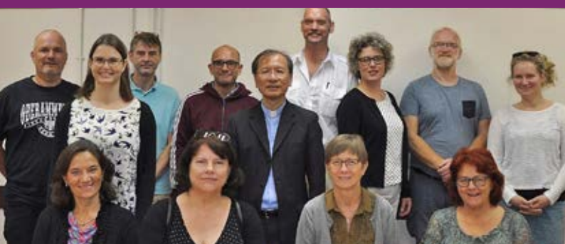
Side 4-5: Med Luther i Østen

Nørre Aaby kirke ♦ 80. ÅRGANG ♦ Nr. 3 ♦ December 2017