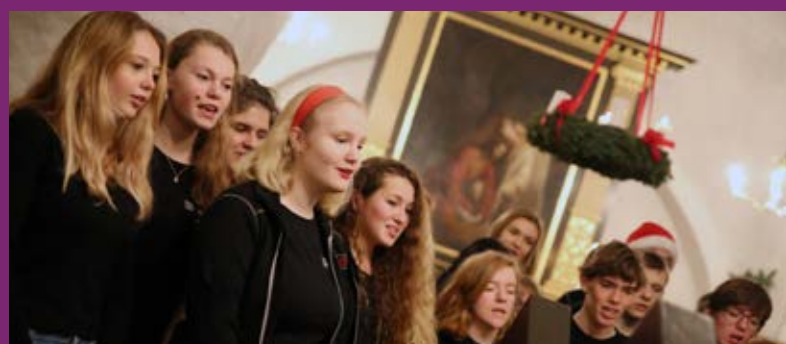
Side 6-7: Julegudstjeneste med Viby Efterskole